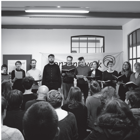
Zu unserem fünften Geburtstag bekamen wir in unserem Büro ein Ständchen vom "Bestaussehendsten Chor".