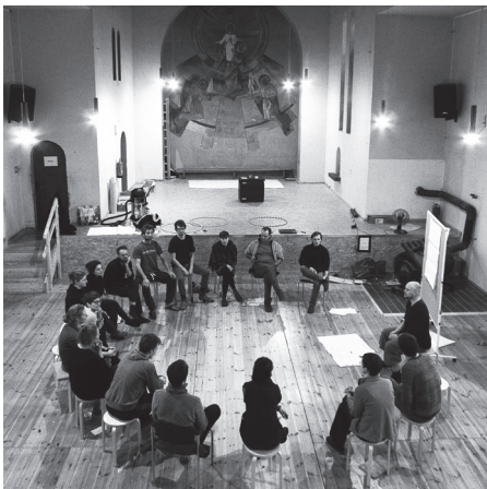
Zwei Mal pro Jahr machen wir einen "Rückzug" - und haben die letzten Male in einer entweihten Kirche getaggt.

Wir feiern zum ersten Mal einen Konzeptwerk-Geburtstag und laden dazu in unser Büro ein. Es gibt Sekt aus Aufstrich-Gläsern und Workshops zu unseren Themen. Am Abend ziehen wir in die "Spelunke" um, wo es Lagerfeuer und Musik bis spät in die Nacht gibt.