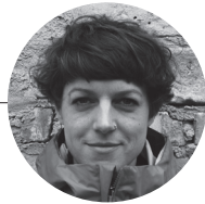
Degrowth-Sommerschule Jesse Dittmar