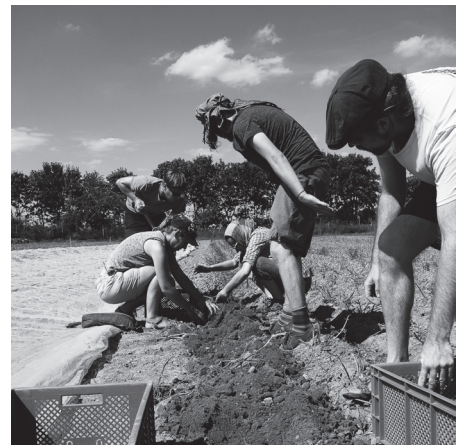
Bei unserem Seminar "Ackern für die Zukunft" ist der Name auch Programm.

Wir arbeiten an einer Anti-Diskriminierungsstrategie, um für Diskriminierungsformen sensibler zu sein und selbst nicht/weniger zu diskriminieren – sowohl in unserer Arbeit nach außen als auch in unserer internen Organisation. Ein Schritt dazu war, dass wir 2017 alle Trainings besuchten, um uns mit unserem Weiß-Sein auseinanderzusetzen. Ein weiterer Schritt war ein Tag mit dem Anti-Diskriminierungstrainer Mutlu Ergün-Hamaz, der uns verschiedene Dimensionen der Anti-Diskriminierung für unsere Arbeit aufzeigte.