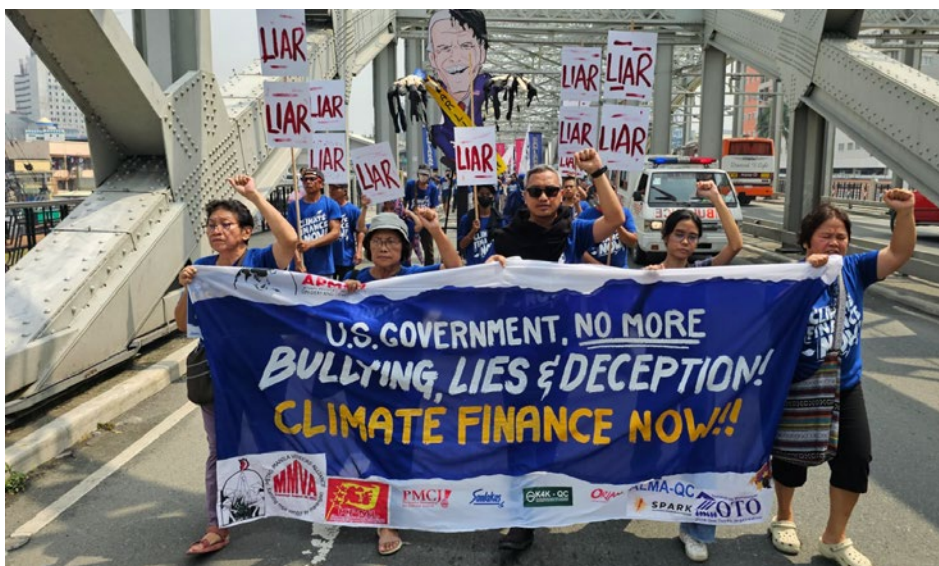
September 23, Asia-wide US Embassy Actions on the US' full delivery of Climate Finance Obligations, Philippines.

Über Deutschland hinaus müssen transformative Finanzierungsquellen öffentlich mobilisiert werden.