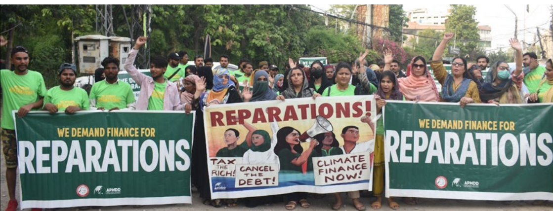
June 23, Paris Summit for a New Global Financing Pact Mobilizations, Nepal.

Demgegenüber übersteigen die tatsächlichen klimabedingten Verwüstungen im Globalen Süden diese Schätzungen bei Weitem und machen die dringende Lücke zwischen dem enormen Ressourcenbedarf und den bereits erlittenen Schäden deutlich.