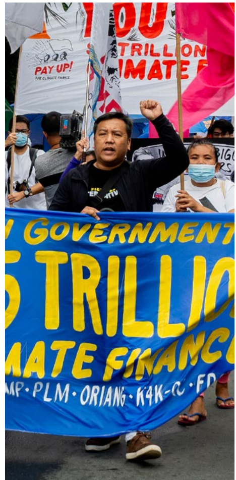
Pay Up Action, Philippines, September 2024.

Schließlich sollte Klimafinanzierung, wo immer möglich, lokal verankert und gemeinschaftsgeführt sein. Direkte Zugangsmechanismen müssen gestärkt werden, damit nationale und subnationale Akteure, Gemeinschaftsorganisationen und soziale Bewegungen Mittel ohne Abhängigkeit von großen internationalen Intermediären erhalten können. Lokales Wissen, lokale Prioritäten und Lösungen müssen die Gestaltung und Umsetzung von Klimamaßnahmen leiten, sodass die Finanzierung Resilienz, Würde und selbstbestimmte Entwicklung unterstützt.