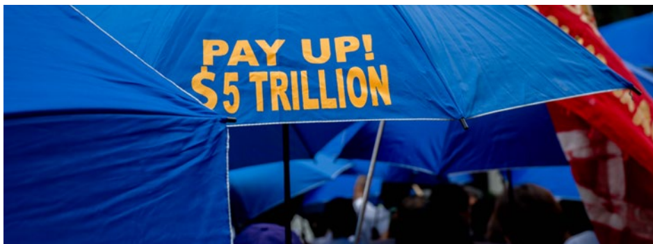
September 2024, Pay Up Action, Philippines.