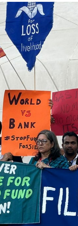
December 2023, COP28 Action on Loss and Damage, Dubai.